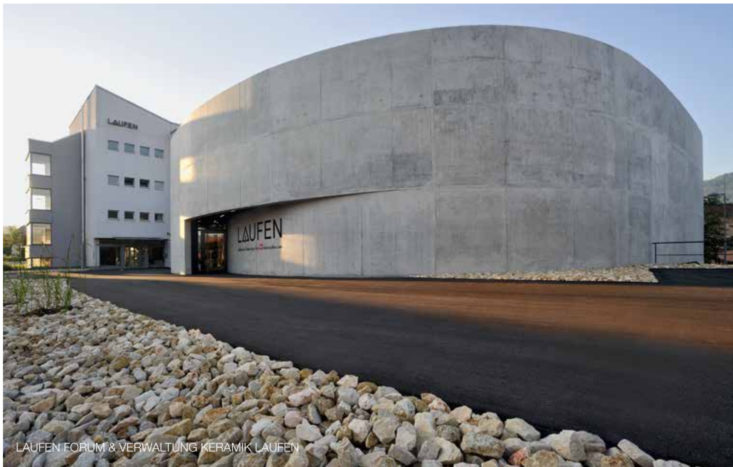
LAUFEN FORUM & VERWALTUNG KERAMIK LAUFEN

Wir freuen uns, Sie in Laufen zu begrüßen.